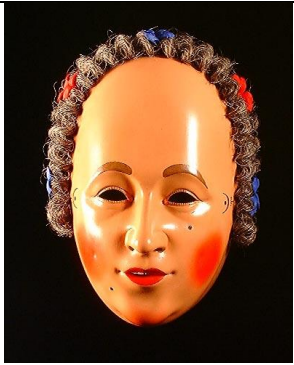
Masque facial de « Narro » , Allemagne, Bade-Wurtemberg, Schwarzwald-Baar, Villingen, fête collective

Date de 1990. Masqué réalisé en bois de tilleul. Visage serein avec bouche souriante et entrouverte, quatre dents apparentes. Pommettes, lèvres, menton peints en rouge; sourcils et cils en brun. Un grain de beauté noir sous l'oeil gauche, un autre sous les lèvres. Cheveux ondulés de couleur poivre et sel (crin) auxquels sont fixées cinq fleurs rouges et bleues (ruban).